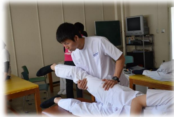
身体機能評価の実習

作業療法士 に必要な医学的知識や専門知識・技術を学ぶだけでなく、心身機能の評価技術や作業療法の治療的応用などについて実習形式で体験的に学習