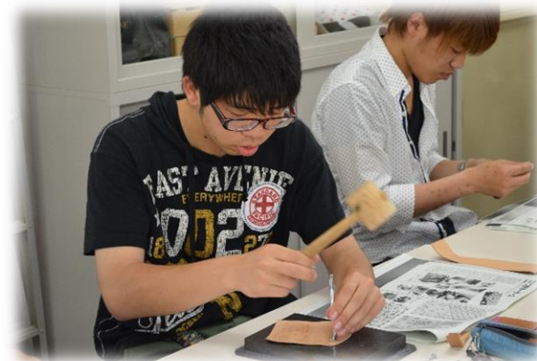
作業活動の実習（革細工）