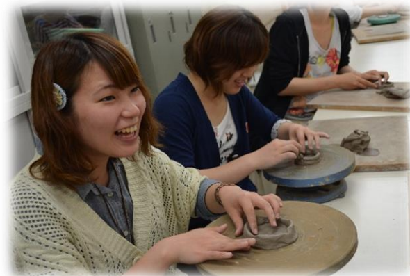
作業活動の実習（陶芸）