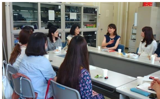
3年生や4年生の質問に、卒業生が率直に答えてくれました。

卒業生からの答えは、「結核などの感染症の担当になると、治療や薬のことを対象者から質問されることがあるので、病院での経験があった方がいいかもしれない」「包括支援センターで働くならば、疾患の病態生理が分かっていた方がいいことも多い」「臨床経験がなくても、感染症や難病などの研修会があり、経験するこ