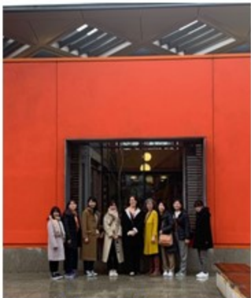
マギーズセンター

マギーズセンターはがんに関わる人への施設で、予約も必要ありません。建物や庭がとてもきれいで英国らしさを感じました。