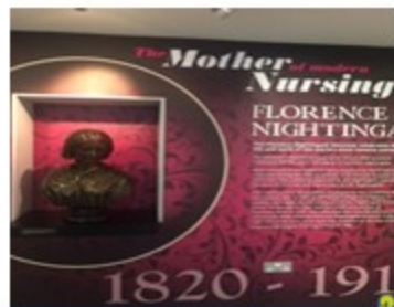
ナイチンゲール博物館

2019/2/28 3~/10 目的：オランダ・英国における人々の健康問題の特徴とその解決のための方策を学習する。