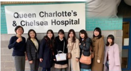
Queen Charlotte's & Chelsea Hospital