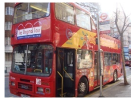
ハリーポッター撮影現場