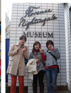
ナイチンゲールミュージアム