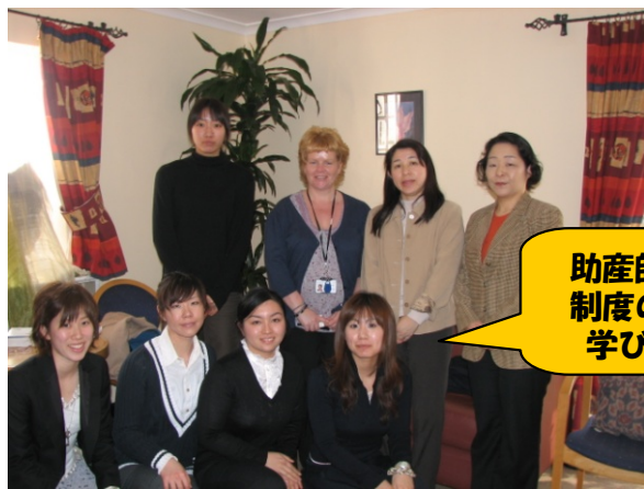
助産師の教育制度の違いを学びました