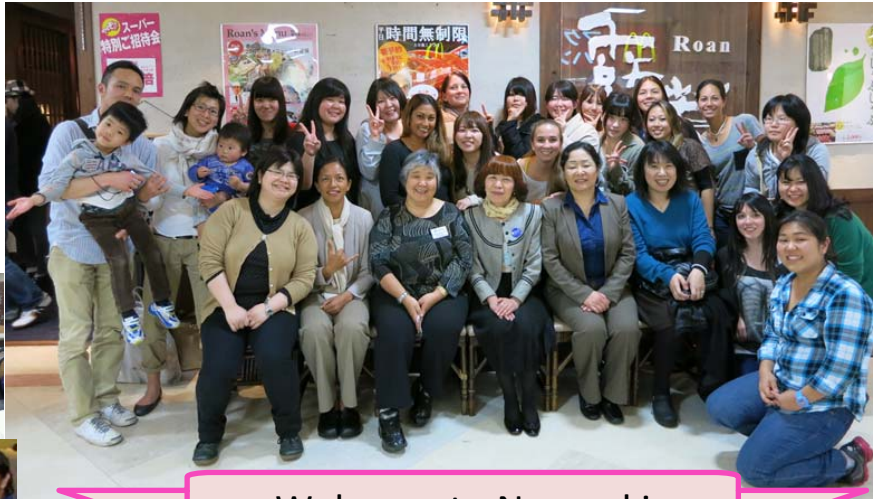
Welcome to Nagasaki