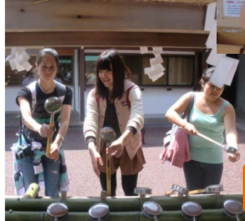
(Bad luckをひいて) I feel very sad!!