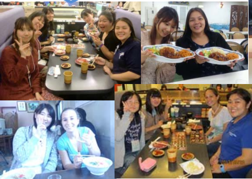
寿司やちゃんぽん、皿うどん、トルコライスなど 日本食や長崎名物を一緒に食べました!!