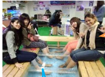
きゃ～くすぐったい