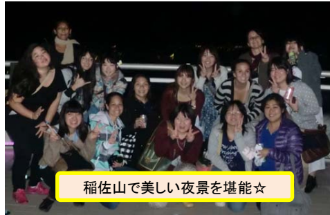
稲佐山で美しい夜景を堪能☆

目的:カウアイ・コミュニティ・カレッジの看護学生と交流し、異なる社会文化的背景を持つ地域であるハワイ(カウアイ島)における保健医療サービスを学ぶ。